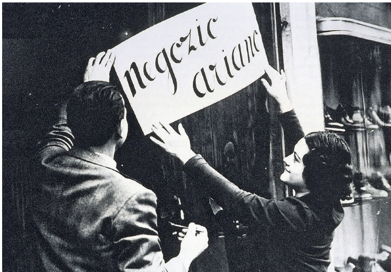
I negozianti avvisano la clientela che la rivendita non è gestita da ebrei.

Le leggi razziali proibivano i matrimoni tra ebrei e non ebrei; gli ebrei impiegati nei posti pubblici o in imprese di rilevanza internazionale venivano licenziati; gli ebrei non potevano avere alle proprie dipendenze domestiche considerate ariane, non potevano essere tesserati al Partito fascista e, inoltre, non potevano essere proprietari di terreni o di fabbricati che superassero un determinato valore.