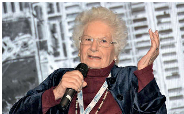
Liliana Segre, testimone vivente degli orrori della Shoah e oggi senatrice della Repubblica italiana.

Ricordo di aver visto il capo del campo buttare la pistola per terra. Era un uomo terribile, crudele, che picchiava selvaggiamente le prigioniere, e in quel momento una parte di me avrebbe voluto raccogliere la pistola e ucciderlo. Fu un istante di vertigine, durante il quale mi sembrò che si fossero invertite le parti: forte io e debole lui. Guardavo l'arma, feci per prenderla convinta di potergli sparare, sicura che ne sarei stata capace. La vendetta mi sembrava a portata di mano."