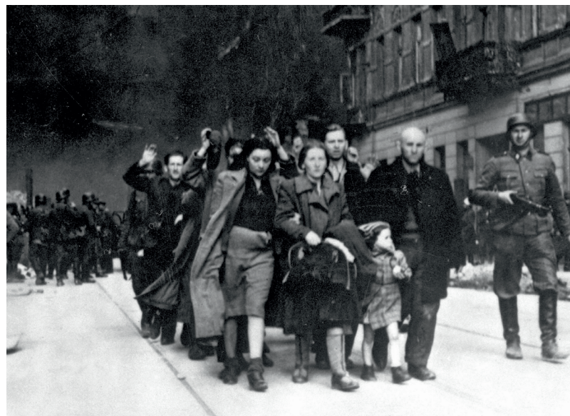
Ebrei deportati dal ghetto di Varsavia nei giorni della rivolta contro i nazisti, primavera 1943.

Gli uomini, le donne e i bambini che vivevano nelle centinaia di piccoli ghetti creati in tutta la Polonia vennero " trasferiti a Est " e uccisi in pochi giorni . Svuotare i grandi ghetti di città come Varsavia o Lodz, dove vivevano centinaia di migliaia di persone, invece, richiedeva un enorme sforzo organizzativo e dei