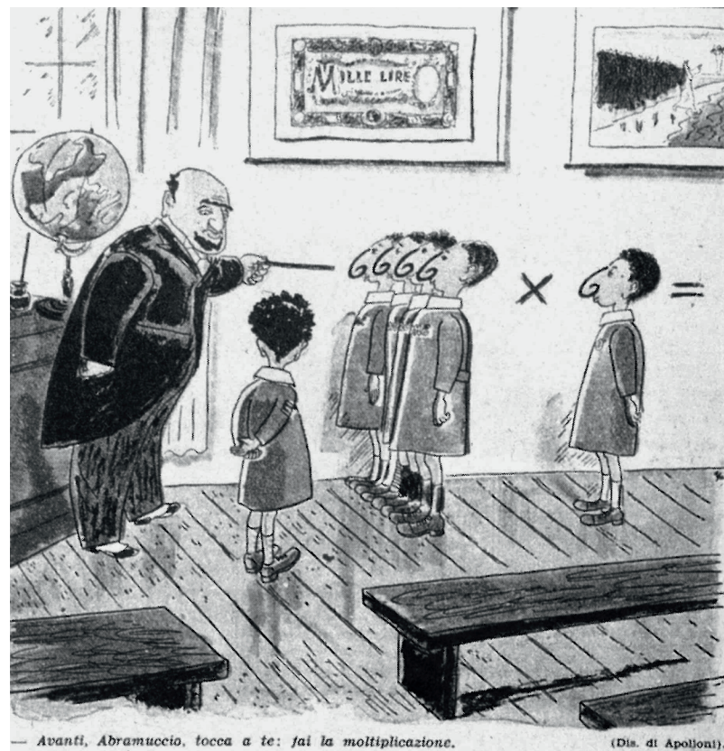
Una vignetta satirica fascista si prende gioco degli scolari ebrei.

Se torniamo all'articolo 3 della Costituzione, dal quale è partita questa digressione storica, capiamo facilmente perché i padri costituenti decisero di menzionare specificatamente qualcosa che oggi a noi pare (forse) scontato, ossia l'uguaglianza di tutti i cittadini senza distinzione di razza .