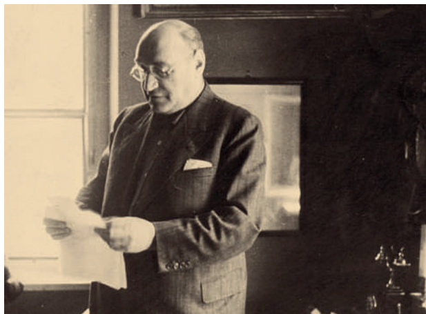
Adam Czerniakov, capo del Consiglio Ebraico del ghetto di Varsavia sotto l'occupazione nazista.

Che scelta aveva Czerniakov? Quali erano le due possibilità che gli si prospettavano e quale sarebbe stato il risultato di una e dell'altra? Secondo te che cosa fece?