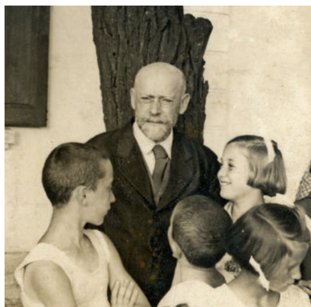
Janusz Korczak, direttore dell'orfanotrofio ebraico di Varsavia negli anni della Seconda guerra mondiale.

E tu cosa avresti fatto? Avrebbe prevalso in te il senso del dovere o la paura dell'ignoto?